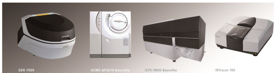
Abb. 2: Kombinierte Analysetechniken für die Analyse von verschiedenen Schadstoffarten in Kunststoffen: XRF, GC-MS, ICP-OES, FTIR

Vergleichbar der XRF-Analyse ist auch die