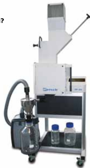
SM 300 mit Zyklon-Sauger-Kombination