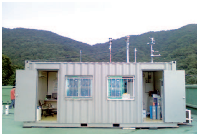
Messstation zur Luftqualitätsüberwachung: nebst anderen Analysengeräten wurde auch ein MARGA-System in diesen Container eingebaut, welches über längere Zeit vollständig automatisiert betrieben werden kann.

Die beschriebene Luftverschmutzung ist sicher ein Extrembeispiel, doch sollte man nicht vergessen, dass die gegenwärtige Luftverschmutzung nach wie vor gravierende Folgen für die Umwelt und unsere Gesundheit hat. Die Erforschung und das Verständnis der Einflüsse von Luftverschmutzung und Luftbestandteilen auf das Klima und unsere Gesundheit sind von grosser Bedeutung. Luftverschmutzung wird nicht allein durch gasförmige Verbindungen verursacht, sondern auch durch Aerosole und Schwebstoffteilchen (englisch: particulate matter, PM). Diese feinsten Partikel gelangen in die Lunge und schädigen sie; ultrafeine Partikel können sich von dort aus über die Blutkörperchen sogar im ganzen Körper verteilen und zu Entzündungssymptomen führen. Obwohl diese Risiken weltweit diskutiert und erforscht werden, ist immer noch nicht bekannt, welche Verbindungen genau zu Schädigungen führen. Somit besteht ein grosser Bedarf an spezifischeren Messdaten und Daten aus Langzeitmessungen. Schnelle Messmethoden und Echtzeitmessungen der Konzentrationen der chemischen Verbindungen in der Umgebungsluft sind ein Muss und sollen ein besseres Verständnis der Zusammenhänge ermöglichen.