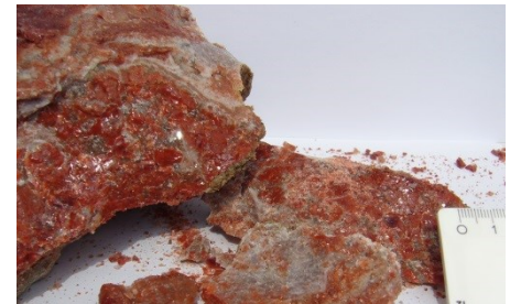
Abb. 1: Eine typische Probe eines Kalisalzes. Gut zu erkennen ist die Inhomogenität.

Kenntnis der mineralischen Zusammensetzung anstehender Salzgesteine sowie deren chemische Zusammensetzung und ebenso der im Verarbeitungsprozess anfallenden Zwischen- und Endprodukte.