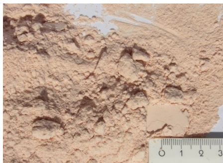
Abb. 2: Kalisalz zerkleinert mit der Rotor-Schnellmühle unter Verwendung des 0,08 mm Siebes.

Es entsteht ein loses gut schüttfähiges Pulver, das unmittelbar dem Probenträger des Messgerätes zugeführt werden kann.