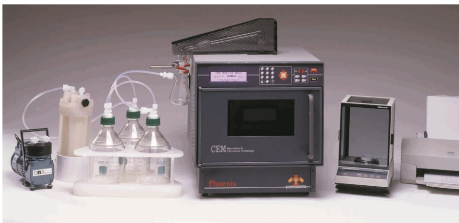
Abb.3: Phönix SAS™

Die besondere Arbeitssicherheit und der Bedienerkomfort des Phönix SAS™ wird durch eine spezielle Absaugtechnik gewährleistet, die CEM auch in anderen Produkten erfolgreich verwendet. Dabei führt aus dem Veraschungseinsatz mit den zu bearbeitenden Proben ein Quarzrohr zu einer Abscheide- und Neutralisationseinrichtung, bestehend aus Waschflaschen und Aktivkohlefilter. Die Rauchgase werden dabei mittels einer Vakuumpumpe abgesaugt und in den Waschflaschen mit NaOH neutralisiert. Der Bediener ist dabei keiner Exposition mit den Verbrennungsprodukten ausgesetzt und durch die Aktivkohlefilter zudem vor Geruchsbelästigungen geschützt. Die Anordnung dieser Neutralisationseinrichtung ist wartungsarm und einfach zu bedienen. Durch den Anschluß von Waage und Drucker an das Veraschungs-System als komplette Arbeitsstation ist eine Dokumentation zur Qualitätssicherung gewährleistet.