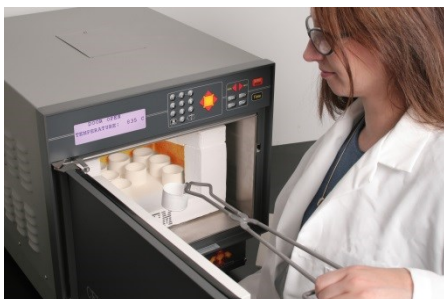
Abb 1: Phönix™

Unter Veraschungen versteht man die thermische Zersetzung kohlenwasserstoffhaltiger Produkte, wobei die anorganischen Bestandteile zurück bleiben. So werden konventionelle Muffelöfen schon seit langer Zeit für die verschiedensten Veraschungen eingesetzt. Dabei wird eine Probe in einem Tiegel eingewogen, welcher vorher getrocknet bzw. ausgeglüht und tariert wurde. Anschließend wird das Probengut in einen konvektiv beheizten Muffelofen gegeben, wo es in der Regel etliche Stunden bis zur Gewichtskonstanz verbleibt. Danach wird der Tiegel aus dem Ofen entnommen und zum Abkühlen für gut eine Stunde in einen Exsikkator gegeben, ehe eine Rückwiegung erfolgen kann. Dieser relativ einfache Prozess ist äußerst arbeits- und zeitintensiv, welches vor allem in der Produktions- und Qualitätskontrolle ein großes Problem darstellt und ein schnelles Zugreifen in laufende Produktionen verhindert. Daraus entstehen nicht selten minderwertige Güter außerhalb der vorgegeben Spezifikation und durch die geminderte Produktqualität verringern sich auch die Erlöse des Herstellers. Neben der laufenden Produktion ist eine schnelle Aschegehaltsbestimmung auch bei Eingangskontrolle von Rohstoffen sowie in der Forschung und Entwicklung von großer Bedeutung.