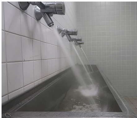
Abb. 2: mehrere Entnahmestellen gleichzeitig öffnen

Die Richtlinie VDI 3810-2/VDI 6023-3 schreibt bei länger als 7 Tagen anhaltendem Stillstand einen vollständigen Wasseraustausch an allen Entnahmestellen durch Spülung mit Wasser nach DVGW W 557 (A) vor. Dort wird im Abschnitt 6.3. beschrieben, dass in dem zu spülenden Abschnitt der Trinkwasser-Installation in der Leitung mit dem größten Durchmesser mindestens eine Fließgeschwindigkeit von 2 m/s erreicht werden muss. Dazu müssen gleichzeitig so viele Entnahmestellen geöffnet werden, dass ein