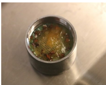
Abb. 3: Verunreinigungen verursachen Biofilm

ausreichender Volumenstrom fließt, um die geforderte Strömungsgeschwindigkeit von 2 m/s in der Leitung mit dem größten Durchmesser zu erhalten.